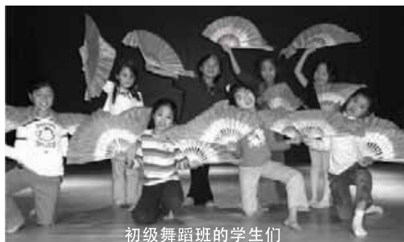
初级舞蹈班的学生们

同时我们也希望家长能更多地帮助、鼓励孩子。也许我们也应该入乡随俗，仿效美国人常做的“matching”，即孩子在学校得够50点或者80点后，家长也同时给孩子相当的奖励。一点小心思，几个小钱，就能让我们的孩子欢呼雀跃，认真学习，为什么不呢？