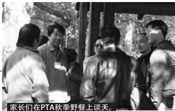
家长们在PTA秋季野餐上谈天。