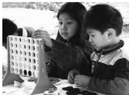
孩子们在秋季野餐时玩游戏。

捐赠，有的公司还为员工的捐赠提供一定比例的公司捐赠(matching)，学校也可向社会募捐。如果会员们充分利用这一条件，你的捐赠就会为我们学校带来成倍的效益，不但为我们继续维持低学费政策提供保证，而且为学校未来提供各种奖学金教金提供可能，也为学校开展各种文化活动奠定基础。另外，南康大学和我校签订的协议中，明确要求我校为非盈利性机构，否则南康大学不可能提供低廉的教学场所。你如果想了解如何捐赠，请参阅学校网站。