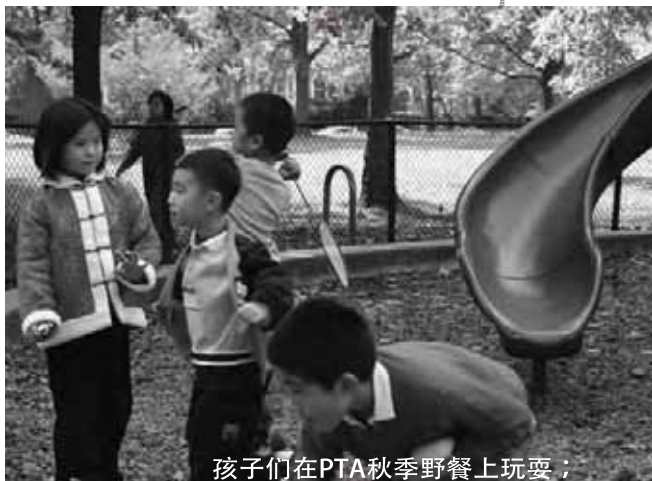
孩子们在PTA秋季野餐上玩耍；

学生安全是我们大家共同关心的主题，希望家长们积极参与、给予支持、提出意见和建议。