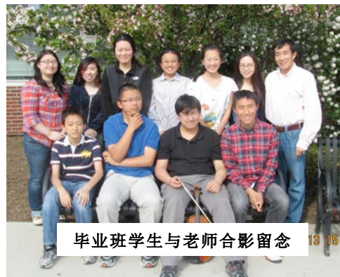
毕业班学生与老师合影留念

南康中文学校第四届毕业典礼将于 5 月 5 日 1 点 20 到 3 点之间在我校 C112 小礼堂举行。届时特邀嘉宾 耶鲁大学东亚语言文学系高级讲师、著名作家苏炜 将为毕业典礼作演讲。孙金华校长将给毕业生颁发毕业证书, 并对八、九、十高年级学习优秀的学生以及数学奥林匹克竞赛获奖学生给予表彰。毕业班学生将以壁报的形式展示他们中文学习的成果。毕业典礼结束后, 将安排小型接待会让毕业生、家长和来宾们共同庆贺。