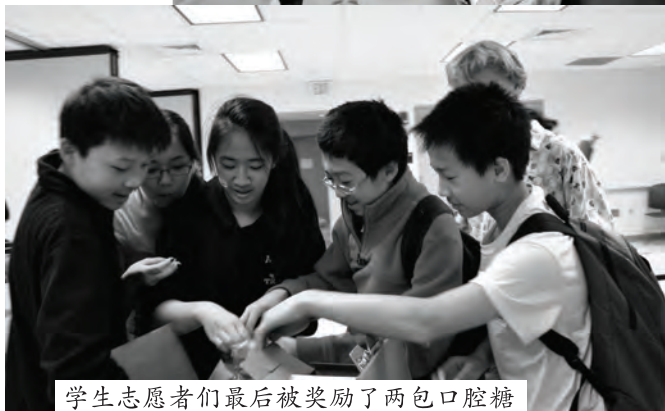
学生志愿者们最后被奖励了两包口腔糖