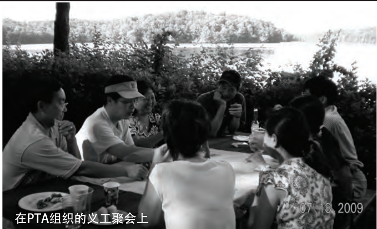
在PTA组织的义工聚会上