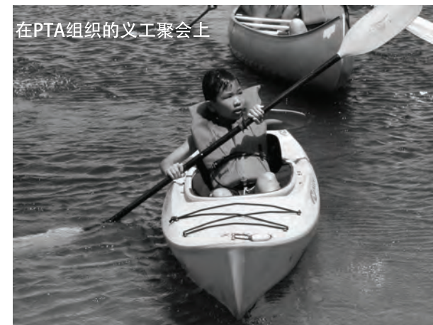
在PTA组织的义工聚会上

我每个星期要给蓝蓝换水。长时间不换水，鱼就会死掉。鱼长到六个月的时候，有一个星期我忘记了换水，我的蓝蓝就死了。我们都很难过，我没有照顾好它。