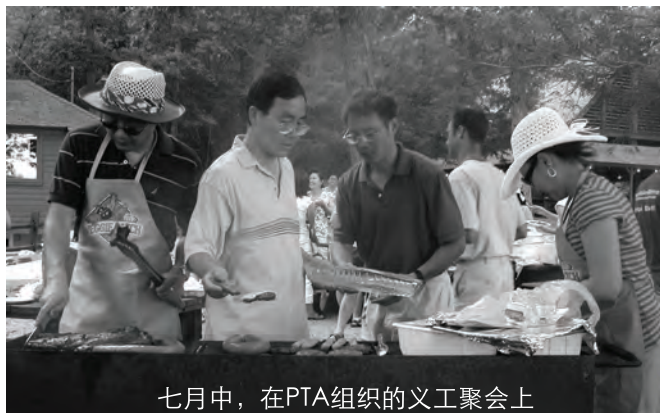
七月中，在PTA组织的义工聚会上