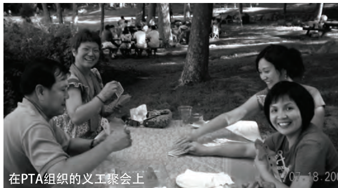
在PTA组织的义工聚会上